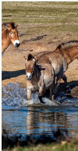
DECOUVERTE DU PARC DES CHEVAUX SAUVAGES DE PREJVALSKI