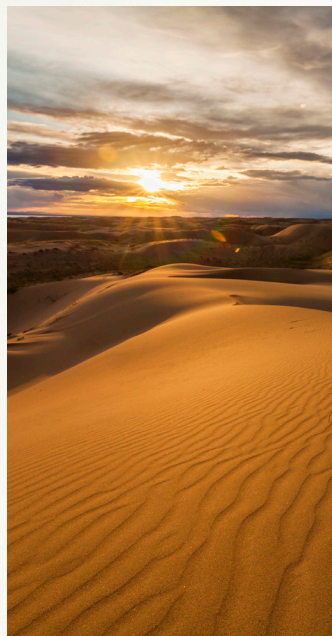
DECOUVERTE DU GOBI ORIENTAL EN TRAIN TRANSMONGOLIEN