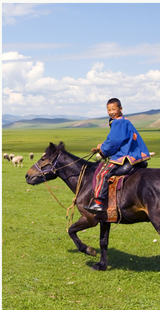
SEJOUR CHEZ LES NOMADES